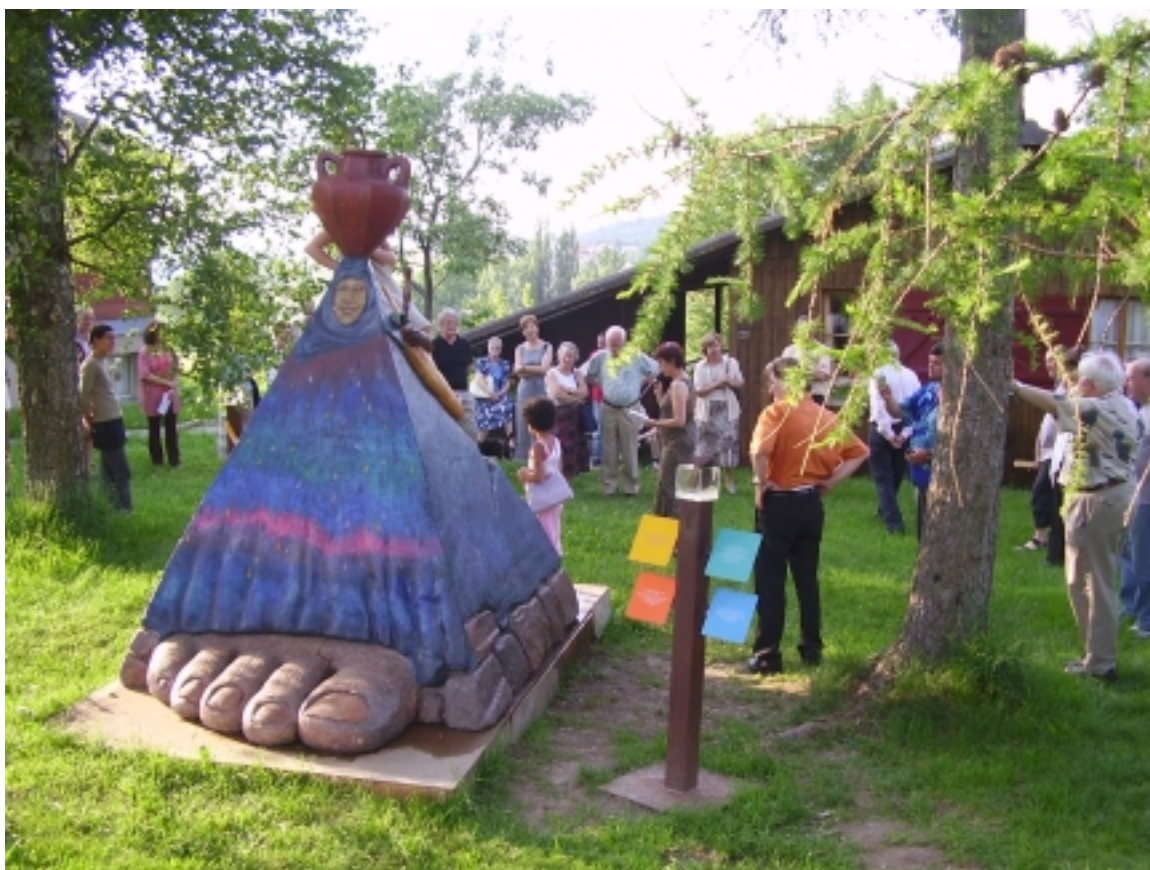
27 mai, centre national à Treyvaux: vernissage de l'exposition «Chemin de découvertes et de rencontres», ouverte tous les jours jusqu'au 17 octobre 2005