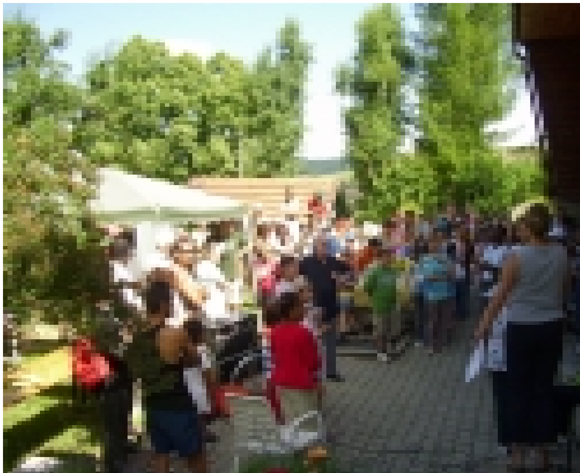
La fête d'été a rassemblé plus de 200 personnes.

L'après-midi, la population de Treyvaux et environs était invitée au spectacle présenté au centre d'ATD Quart Monde par le cirque des enfants "Toamème" de Fribourg.