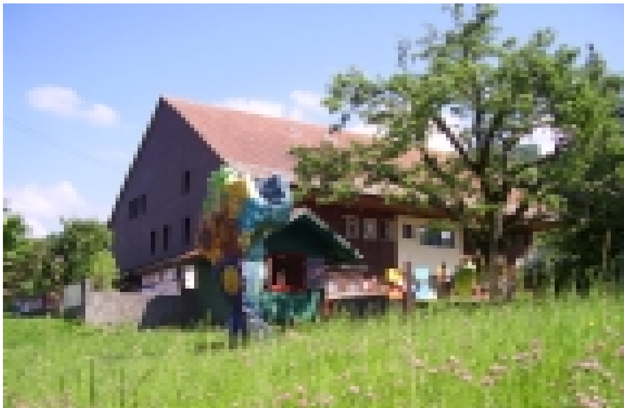
La maison d'ATD Quart Monde à Treyvaux, été 2005

Information Quart Monde et toute l'équipe des volontaires en Suisse vous remercient de votre soutien et vous souhaitent de belles fêtes et une bonne année 2006!