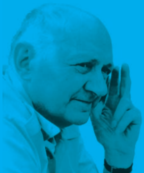
Joseph Wresinski Fondateur

Centre national Treyvaux : Accueil et formation